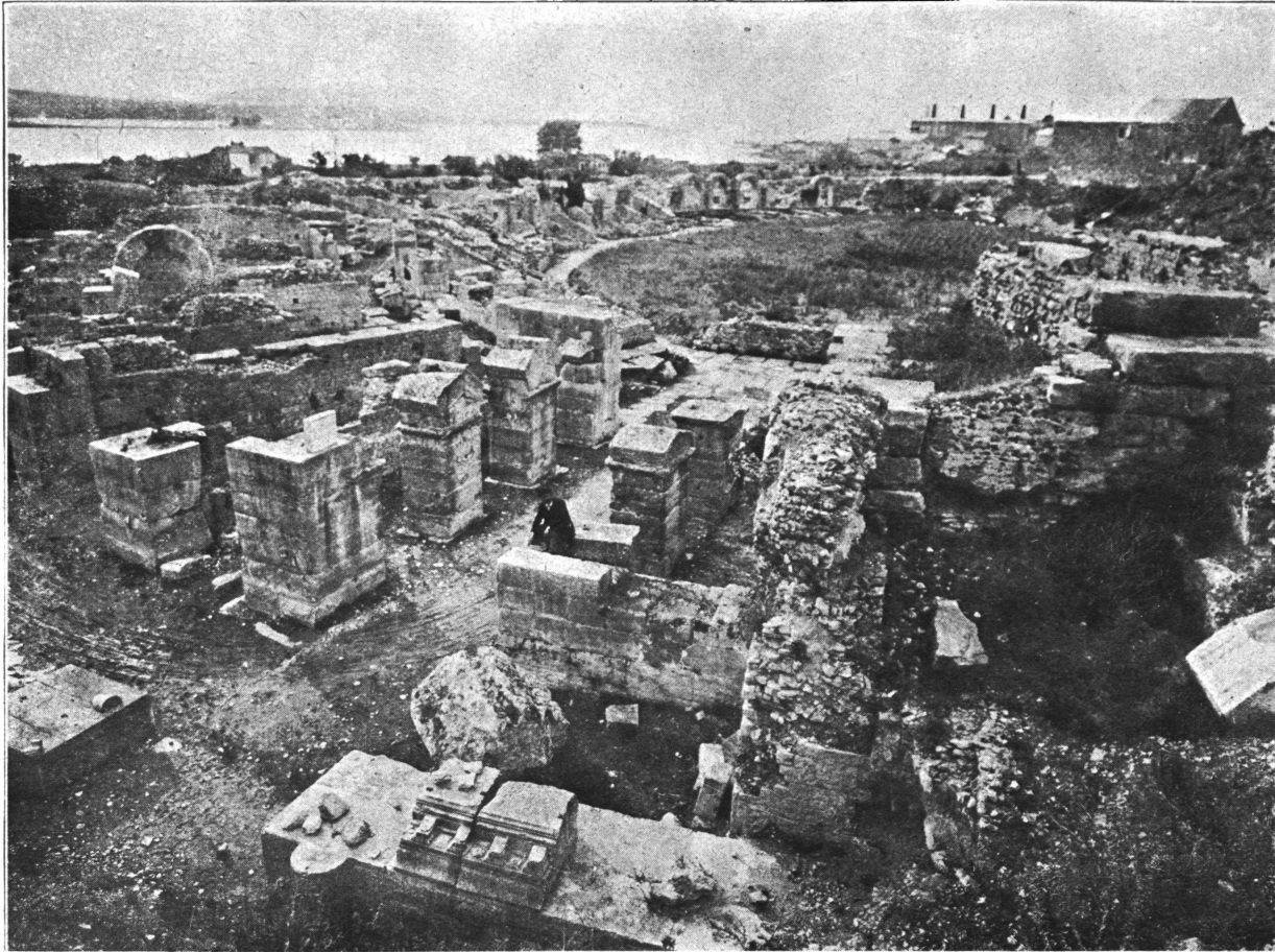
Anfiteatro di Salona fotografato dopo finiti gli scavi da Est ad Ovest (ad p. 81 ss.).