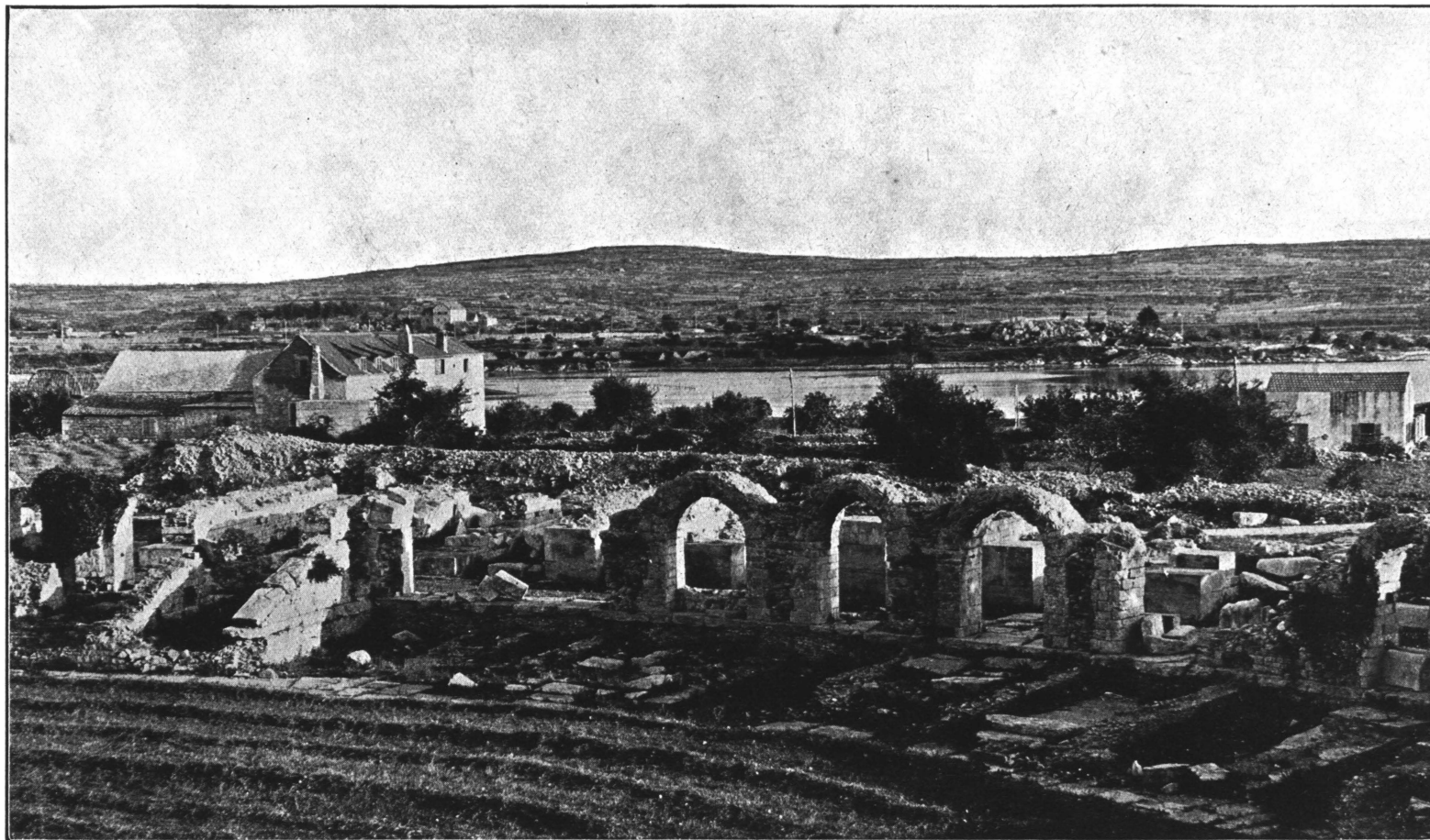
Anfiteatro di Salona preso dopo finiti gli scavi da Owest ad Est (ad p. 81 ss.).